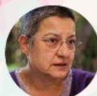
ŞEBNEM KORUR FINCANCI VORSITZENDE DER TÜRKISCHEN ÄRZTEUNION

2. SITZUNG - 15:00 / DIE SITUATION DER MENSCHENRECHTE IN DER TÜRKEI