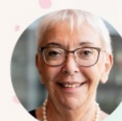
LALE AKGÜN AUTORIN