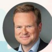
FRANK SCHWABE SPD