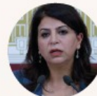
SIBEL YİĞİTALP EHEM. HDP - ABGEORDNETE