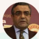
SEZGIN TANRIKULU ABGEORDNETER - CHP